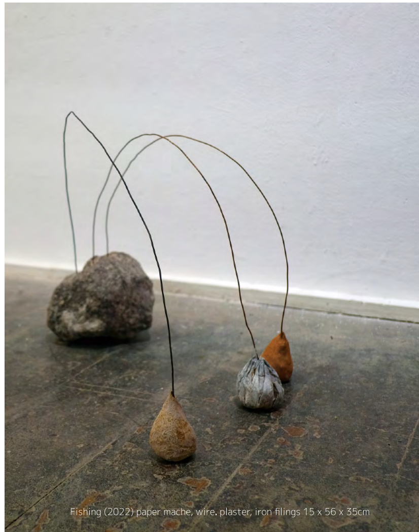
Fishing (2022) paper mache, wire, plaster; iron filings 15 x 56 x 35cm

Precarious elements within the work can often be adjusted to allow them to balance temporarily in the space. Familiar yet alien at the same time the forms present in both sculptures and drawings feel as though they are exploring, leaning, feeling, listening.